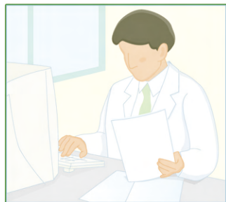
医師によるオーダーチェック

インフォコム処方チェックシステムは、医薬品チェックデータとデータメンテナンス機能を備え、電子カルテシステム、オーダーリングシステムなどの病院情報システムで総合的・多角的にご利用いただけるサービスです。オーダー確定時の一括チェックはもちろんのこと、処方・注射オーダー時におけるリアルタイムチェック、さらには病院様ごとのニーズに応じた細かいチェック仕様まで設定出来ます。長年の実績に裏付けられた確かな技術をベースに、信頼のおけるデータ提供、院内利用マスターのメンテナンス統一化など、医薬品の安全使用に必要なサービスをご提供します。